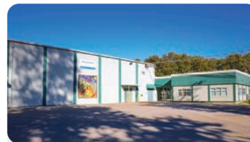
BEACH GROVE ELEMENTARY Población escolar: 300