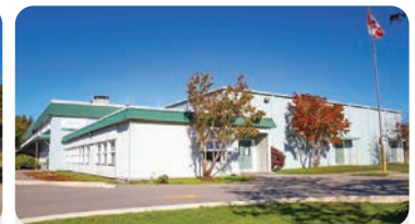
CLIFF DRIVE ELEMENTARY Población escolar: 300