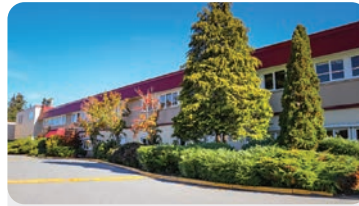
DEVON GARDENS ELEMENTARY 학교 정원: 350명