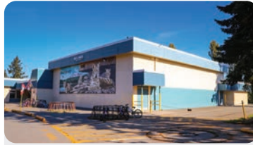
HELLINGS ELEMENTARY 학교 정원: 300명