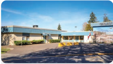
GRAY ELEMENTARY 학교 정원: 500명