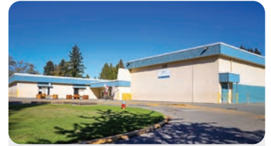
JARVIS ELEMENTARY 학교 정원: 450명