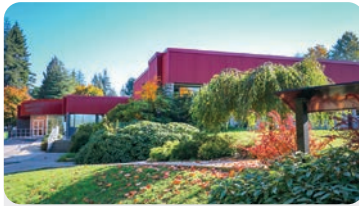
COUGAR CANYON ELEMENTARY 학교 정원: 500명