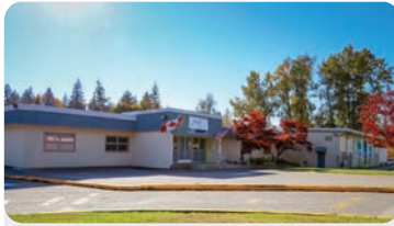
HEATH ELEMENTARY 학교 정원: 225명