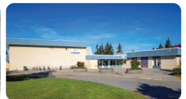
BROOKE ELEMENTARY Numero di studenti: 300