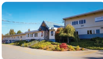
ANNIEVILLE ELEMENTARY Numero di studenti: 280