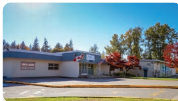
HEATH ELEMENTARY Numero di studenti: 225