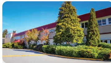
DEVON GARDENS ELEMENTARY Anzahl der Schüler/innen: 350