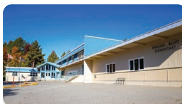
ENGLISH BLUFF ELEMENTARY Anzahl der Schüler/innen: 200