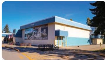
HELLINGS ELEMENTARY Anzahl der Schüler/innen: 300