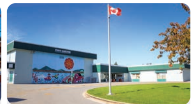
PORT GUICHON ELEMENTARY Anzahl der Schüler/innen: 175