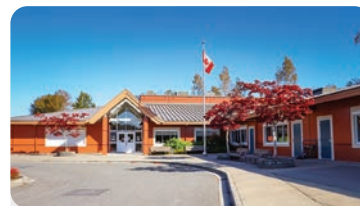
NEILSON GROVE ELEMENTARY Anzahl der Schüler/innen: 175