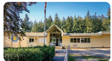
SUNSHINE HILLS ELEMENTARY Anzahl der Schüler/innen: 500