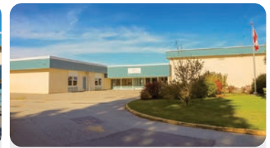
HOLLY ELEMENTARY Anzahl der Schüler/innen: 350