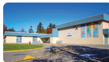
PEBBLE HILL ELEMENTARY Anzahl der Schüler/innen: 250