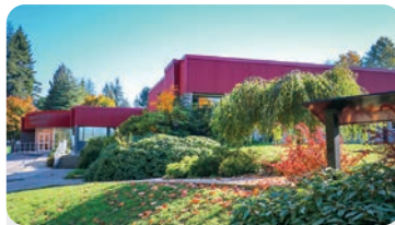
COUGAR CANYON ELEMENTARY Anzahl der Schüler/innen: 500