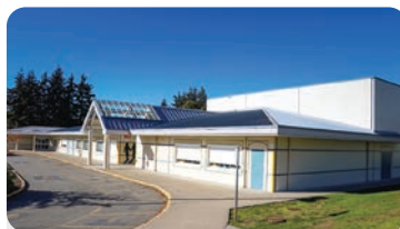
RICHARDSON ELEMENTARY Anzahl der Schüler/innen: 400