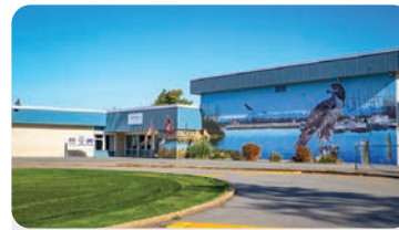
HAWTHORNE ELEMENTARY Anzahl der Schüler/innen: 450