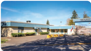
GRAY ELEMENTARY Anzahl der Schüler/innen: 500