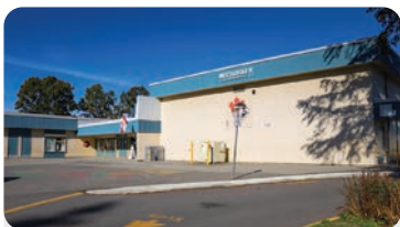
MCCLOSKEY ELEMENTARY Anzahl der Schüler/innen: 350