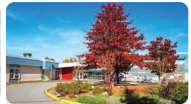
GIBSON ELEMENTARY Anzahl der Schüler/innen: 400