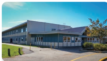
LADNER ELEMENTARY Anzahl der Schüler/innen: 450