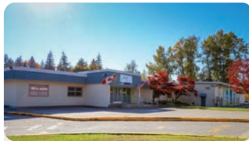
HEATH ELEMENTARY Anzahl der Schüler/innen: 225