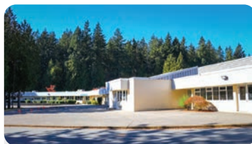
PINEWOOD ELEMENTARY Anzahl der Schüler/innen: 300