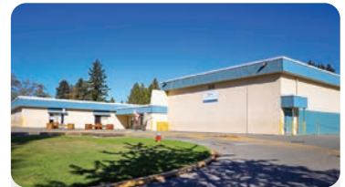
JARVIS ELEMENTARY Anzahl der Schüler/innen: 450