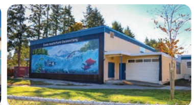
SOUTH PARK ELEMENTARY Anzahl der Schüler/innen: 400