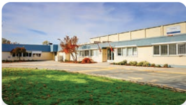
CHALMERS ELEMENTARY Anzahl der Schüler/innen: 475