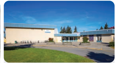
BROOKE ELEMENTARY 学生人数:300