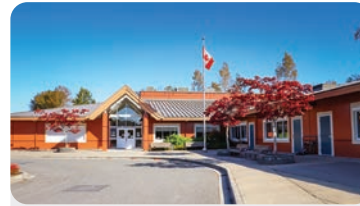
NEILSON GROVE ELEMENTARY 学生人数:175