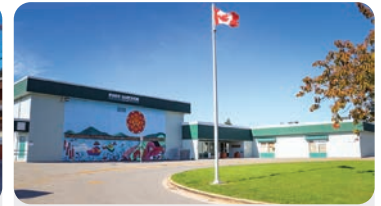
PORT GUICHON ELEMENTARY 学生人数:175