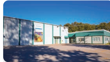
BEACH GROVE ELEMENTARY 学生人数:300